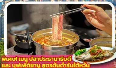
พิเศษ! เมนู ปลาประธนาธิบตี และ บุฟเฟต์ชาบู สูตรต้นตำรับไต้หวัน

เดินทาง มกราคม- มีนาคม 66 เดินทางโดยสายการบิน Vietjet Air (VZ) น้ำหนักกระเป๋า 20 KG CARRY ON 7 KG