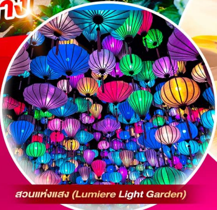
สวนแห่งแสง (Lumiere Light Garden)