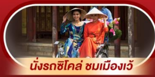
นั่งรถช็อคโล่ ชมเมืองเว้