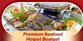
Premium Seafood Hotpot Boatget