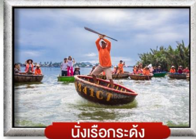
นั้่งเรือกระด้าง