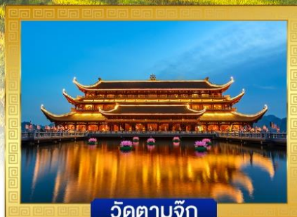
วัดตามจุก