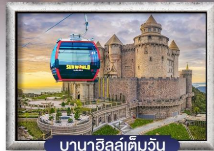
บาน่าฮิลล์เต็มวัน